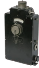
理研ガス検定器3型 (1930年開発)