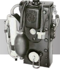
理研ガス検定器18型 (1952年開発)